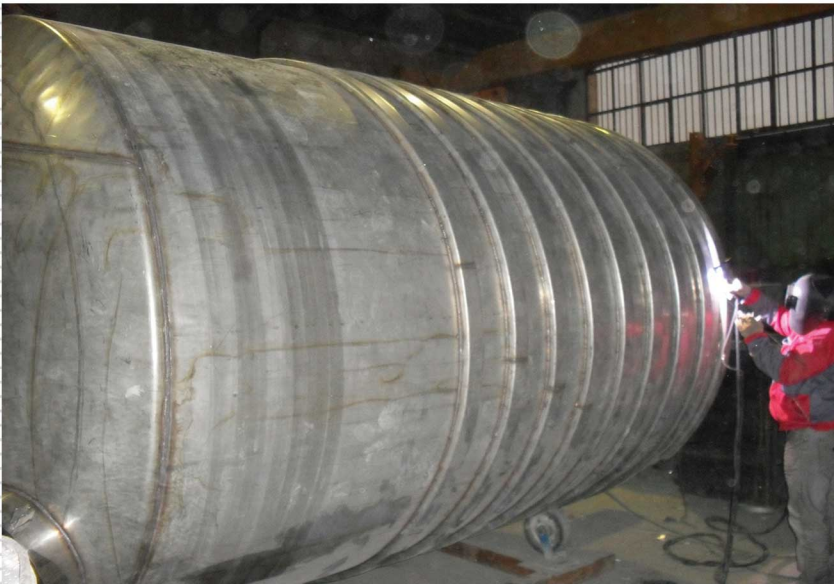
راکتور تمام استنلس استیل شیمیایی به سفارش شرکت صنایع شیمیایی اصفهان