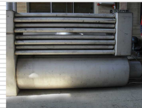
نمونه هایی از مخازن نگهداری- اتوکلاو- یونیت های حرارتی و انواع سختگیر