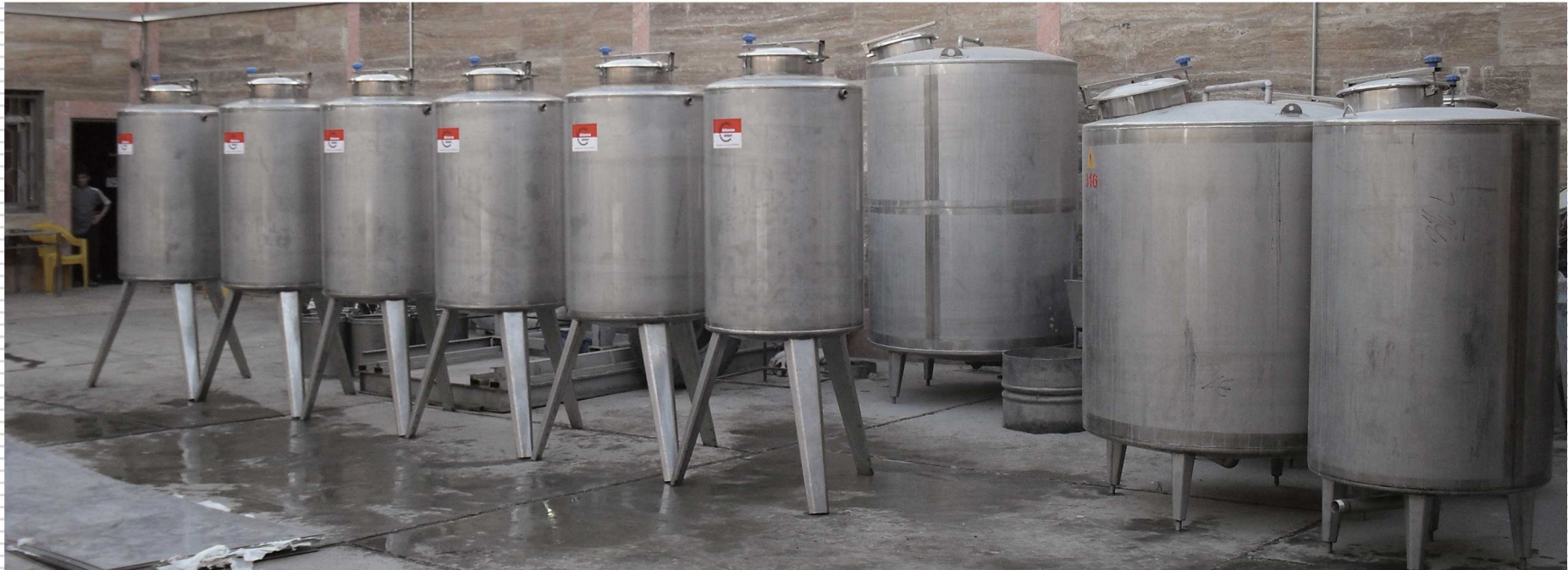
نمونه ای از مخازن نگهداری به سفارش شرکت بهداران طب