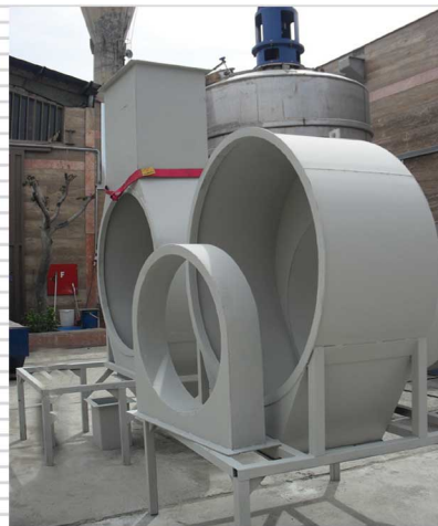
سازه های مختلف مربوط به پروژه شرکت فن اندیش (شهرداری تهران)