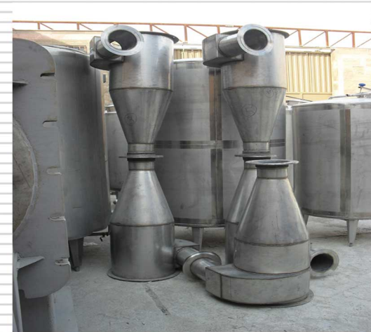
سیکلونهای تمام استنلس استیل