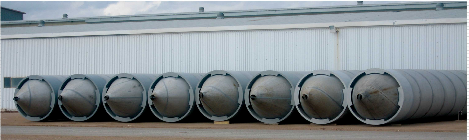
مخازن یکصد تنی تمام استنلس استیل به سفارش شرکت راک سرامیک (محل اجرای پروژه شهرضا اصفهان)