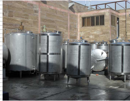
مجتمع کشت و صنعت ابکار گلستان