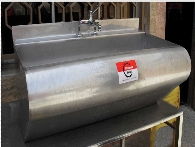
نمونه ای از سینک دستشوئی اطاق عمل