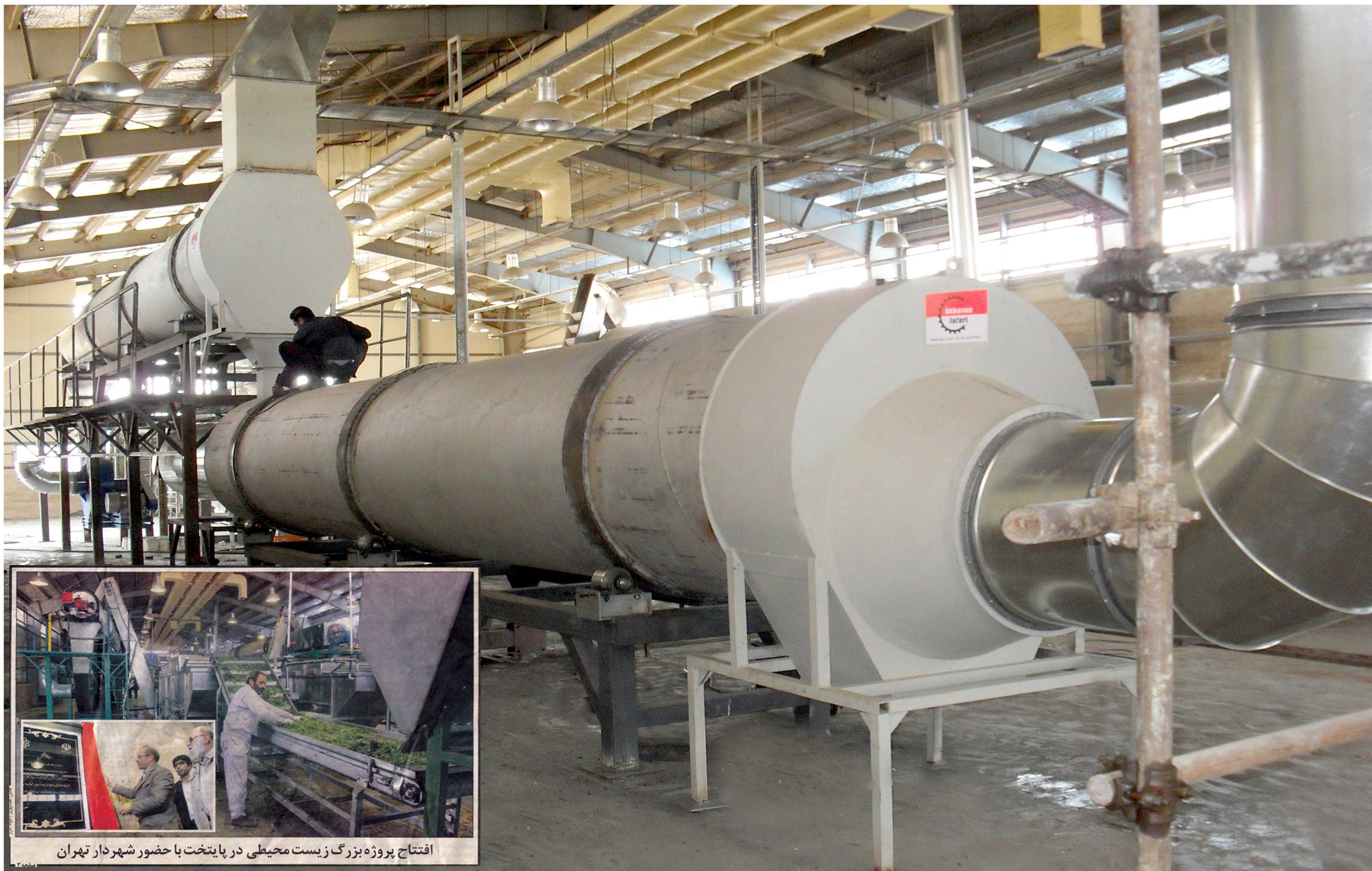
افتتاح پروژه بزرگ زیست محیطی در پایتخت با حضور شهردار تهران