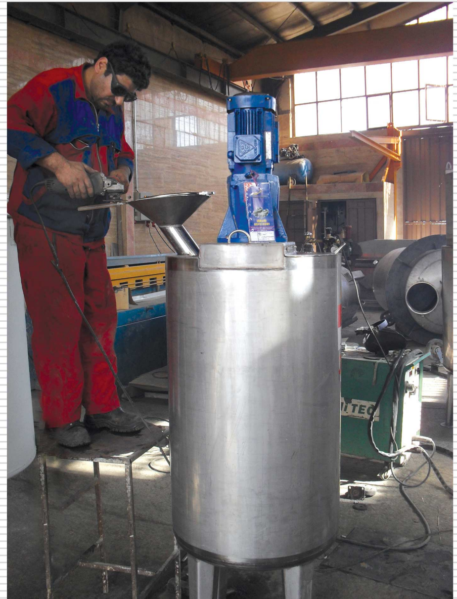
نمونه ای از مخازن به سفارش شرکت شیمیایی پاکشو