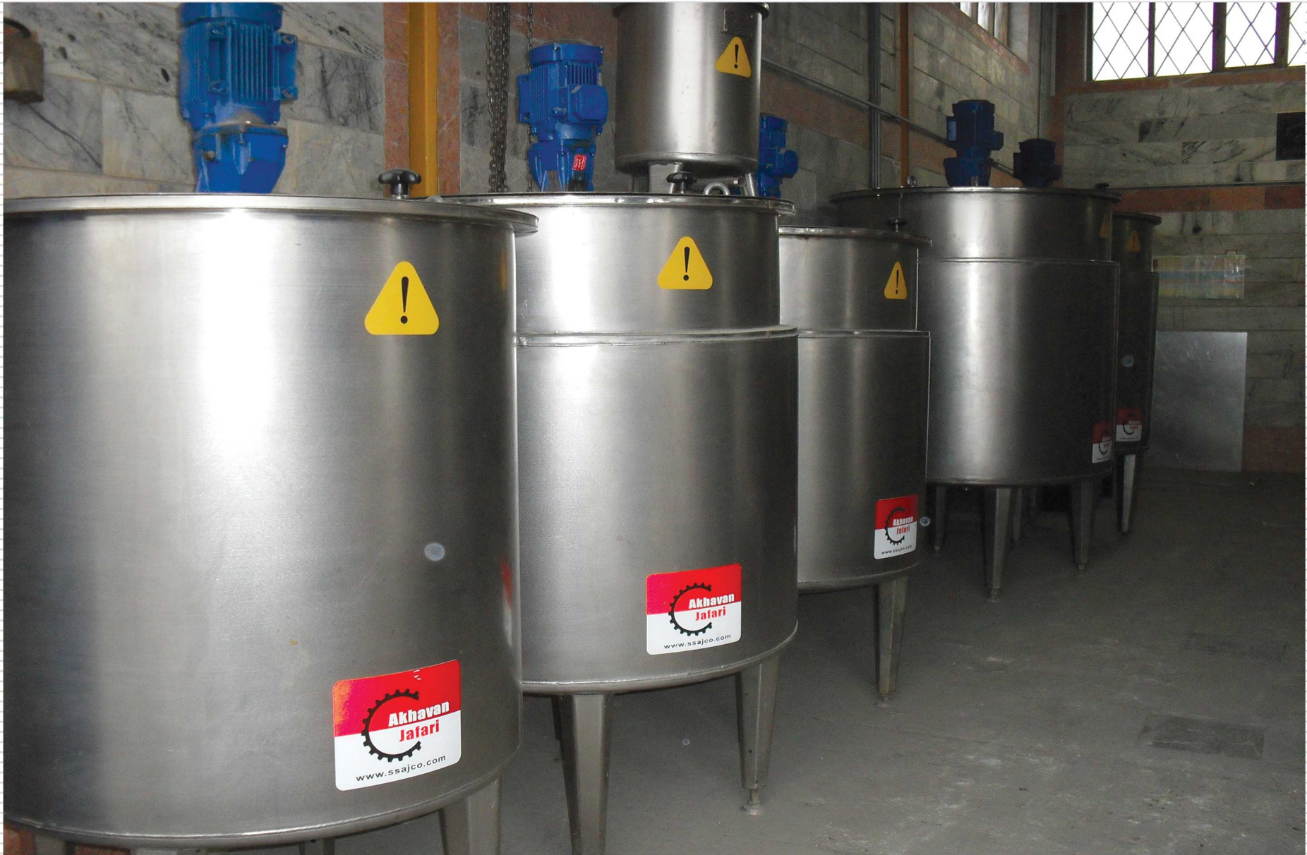
نمونه هایی از میکسر های صنایع غذایی، دارویی، آرایشی، بهداشتی و شیمیایی در ظرفیتهای مختلف