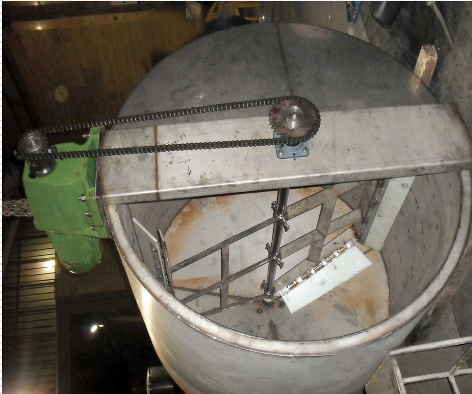
نمونه ای از میکسر تولید محصولات بهداشتی و آرایشی (کرم و ژل مو) استنلس استیل ۳۱۶